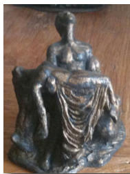
SCULPTURES DE B. B.